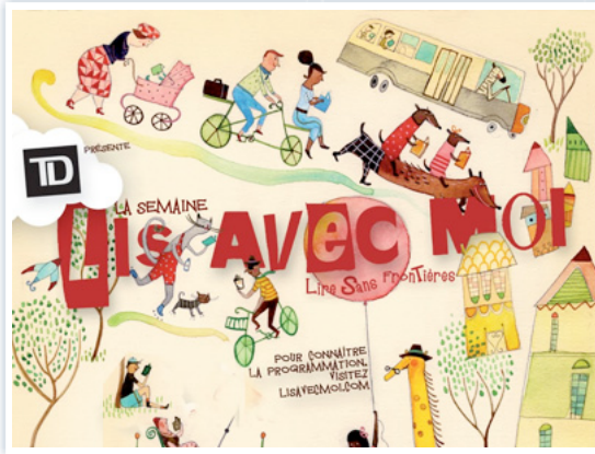
Lis avec moi vous invite à vous engager à lire en famille Crédits : © Illustration Québec

Article publié le : mardi 11 octobre 2011